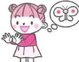
右手でパーを出し、左手もパーを出し、腕を動かしてちょうちよのようにひらひら動かす。