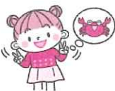
右手でチョコキを出し、左手もチョコキを出し、両手をチョコキチョコキしてカニの足のように動かす。