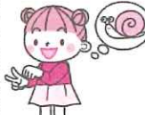
右手をチョコキにして、左手はクーにして、チョコキにした手の甲の上にクーを乗せて、かたつむりのように動かす。